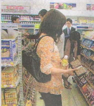
コンビニ内の初開設となり、アンテナショップ「ありんく」が6日、愛知県名古屋市のローソン名駅南広小路店に開設された。

コンビニエンスストア内への出店では初となる県のアンテナショップ「ありんくりんSHOP」が6日、愛知県名古屋市の「ローソン名駅南広小路店」に開設された。関係者らは来店者に星砂キーホルダーなどを贈呈し、オープンを祝った。